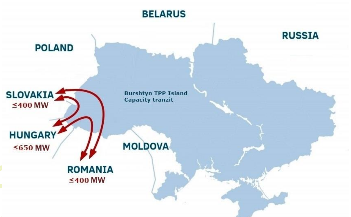
Мал. 2 Мапа транзиту електроенергії мережами «острову Бурштинської ТЕС»

Використання технічного потенціалу «острову Бурштинської ТЕС» дозволяє країні отримувати додаткові економічні переваги від здійснення транзиту електричної енергії за наявності вільної пропускної спроможності електричних мереж.