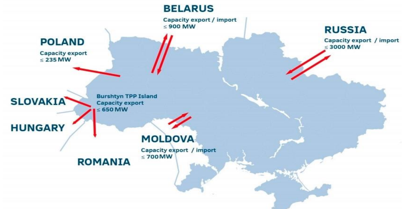
Мал. 1 Мапа експортного потенціалу енергосистеми України

Енергоринок України характеризується профіцитом виробничих потужностей. З урахуванням ситуації на ринку електроенергії в Україні та пропускну здатність електричних мереж експортний потенціал української електроенергії становить близько 10 млн. МВт*год на рік.